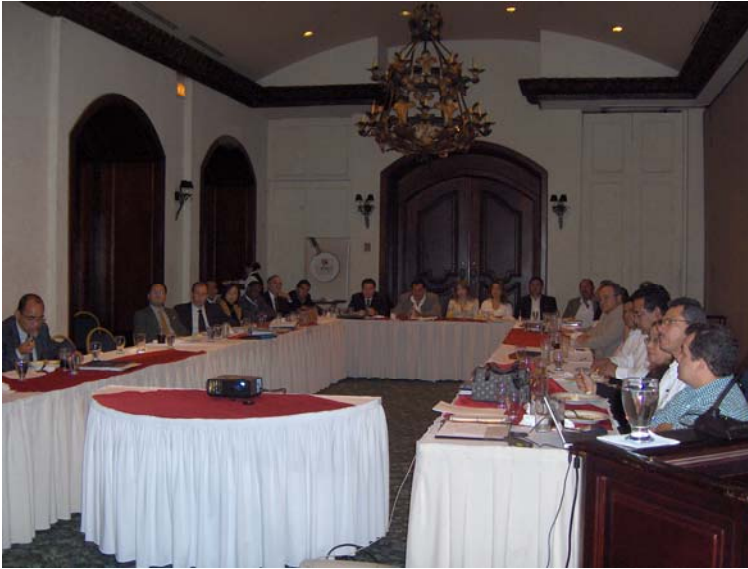
Asistentes de la presentación Sistema Logístico Interoceánico (SLI), Hotel Clarion de Tegucigalpa.